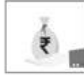
वैयक्तिक कर्ज १५% व्याजदर