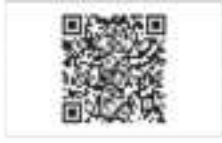
QR कोड सुविधा