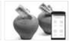
मोबाईल मनी कलेक्शन