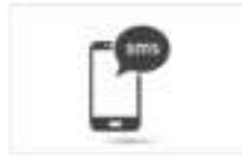
SMS बँकिंग सुविधा