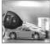
वाहन कर्ज १२% व्याजदर