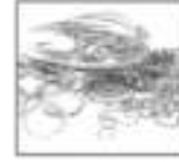
सोने तारणी कर्ज ११% व्याजदर