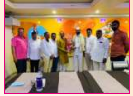
संस्थेच्या नवनिर्वाचित संचालक सल्लागार मंडळ यांची निवड करण्यात आली, त्यावेळी त्यांचा सत्कार करताना संचालक, सल्लागार मंडळ