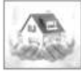
व्यवसाय/तारणी कर्ज १४% व्याजदर