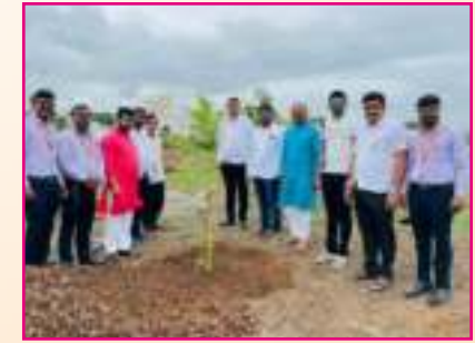
श्री समर्थ पतसंस्थेच्या वतीने वृक्षारोपन करताना संचालक, सल्लागार मंडळ व ग्रामस्थ