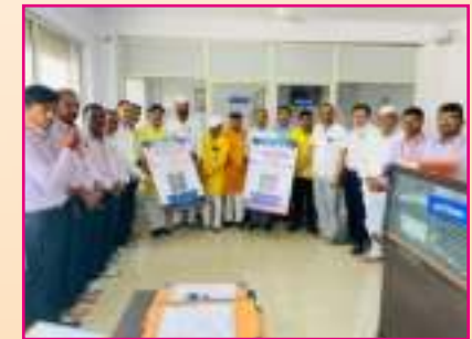
खालुब्रे शाखा QR Code उद्घाटन समारंभ