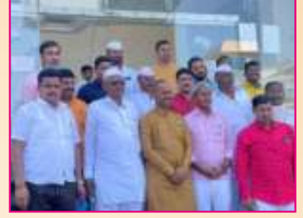
पतसंस्थेच्या वतीने अहमदनगर जिल्हातील ज्योती-क्रांती पतसंस्था, नागेबाबा मल्टीस्टेट, महात्मा फुले पतसंस्था व स्वामी विवेकानंद पतसंस्था या पतसंस्थांचा अभ्यास दौरा करण्यात आला. यावेळी उपस्थित संचालक, सल्लागार मंडळ